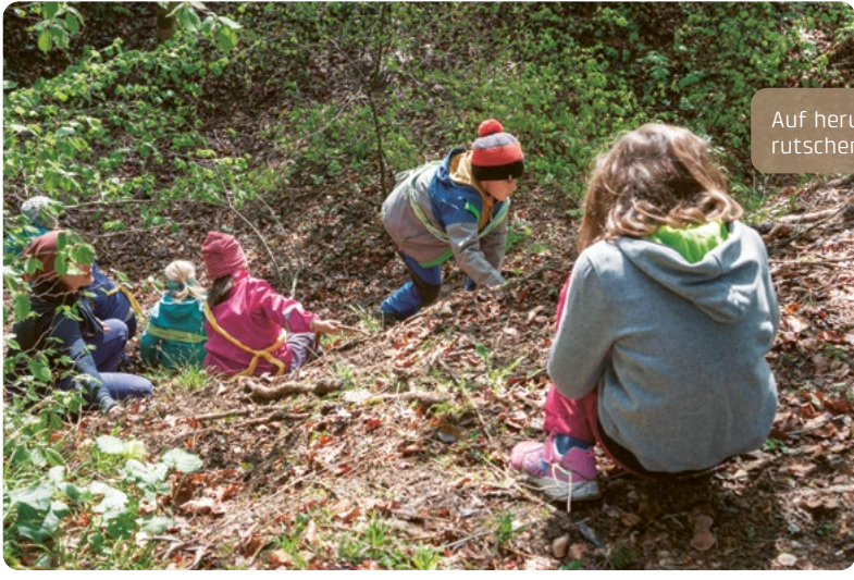
Auf heruntergefallenem Laub einen Hang hinunter- rutschen macht den Kindern grossen Spass.